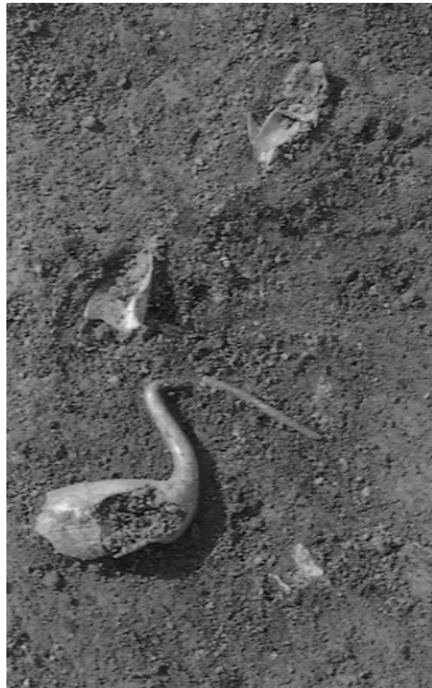
Fig. 1.- Photographie de l'oiseau encore en place sur le terrain.

Des éléments apparemment semblables sont conservés au musée Borely de Marseille (11).